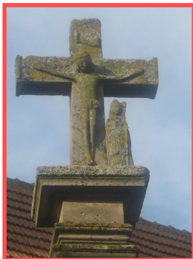
La croix en pierre