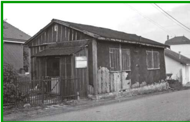
Baraque reconstruite (charpente et cloisons d'origine)