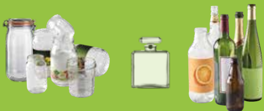
Bouteilles, pots, bocaux en verre