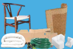
Cartons bruns, meubles, polystyrène de calage, éléments en bois ou en métal, matelas, gravats, plâtre