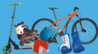
Articles de sport et de loisirs, tous leurs accessoires