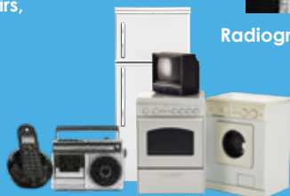
Equipements électriques et électroniques