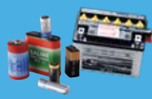
Batteries, piles, huiles alimentaires ou de vidange, filtres à huile