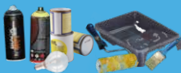
Peintures, solvants, néons, ampoules, aérosols, produits phytosanitaires, cartouches d'encre, pinceaux, rouleaux et bacs de peinture