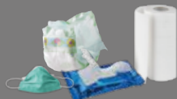
Masques, protections, lingettes, papiers d'hygiène et d'essuyage