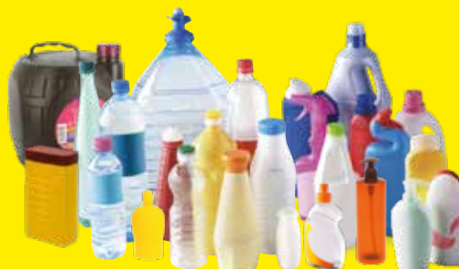
Bouteilles, flacons, bidons en plastique