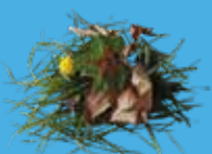
Branchages, feuilles, tontes