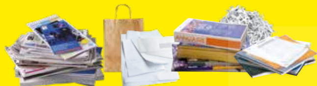
Magazines, journaux, enveloppes, lettres, cahiers