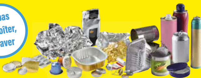
Emballages en acier et en aluminium