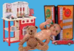
Jeux et jouets