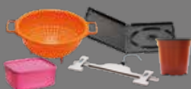
Objets en plastique