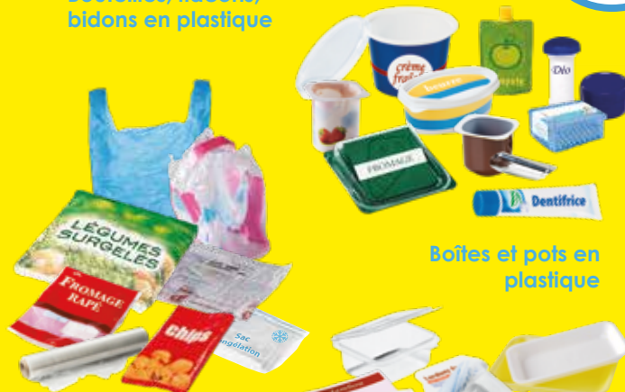
Sacs, suremballages et films en plastique