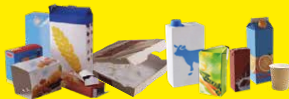
Cartonnettes, briques alimentaires